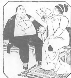
La gordura es peligrosa y ridícula

Procedimientos prácticos en la enseñanza mercantil.—Cálculos pertenecientes á todos los géneros.—Idiomas.—Taqüigrafía.—Matemáticas.—Administración.—Damos el título de Tenedor de Libros.—Véanse prospectos.