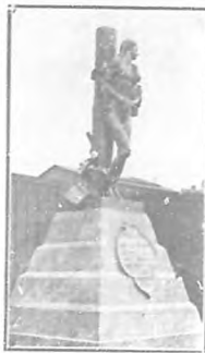
Monumento a La Barre