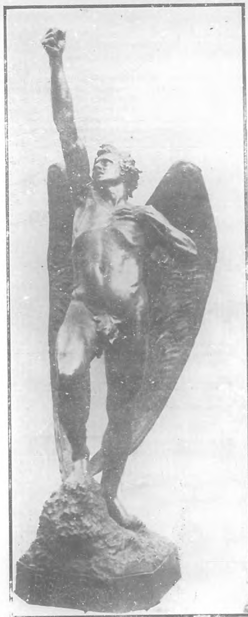
EL ANGEL REBELDE

Salvatori Bioní, autor del monumento á Martí, erigido en Matanzas, es autor también de "El Angel Rebelde," hermosa escultura que coronará la gloriosa del Malecón de nuestra ciudad. Es "El Angel Rebelde" una figura acabada, de factura y expresión correctísimas y que constituirá un alicorno de gran valor artístico. Salvatori Bioní ha conseguido en concurso internacional la ejecución del monumento á Ignacio Agramonte, que se ha de levantar en Camagüey.